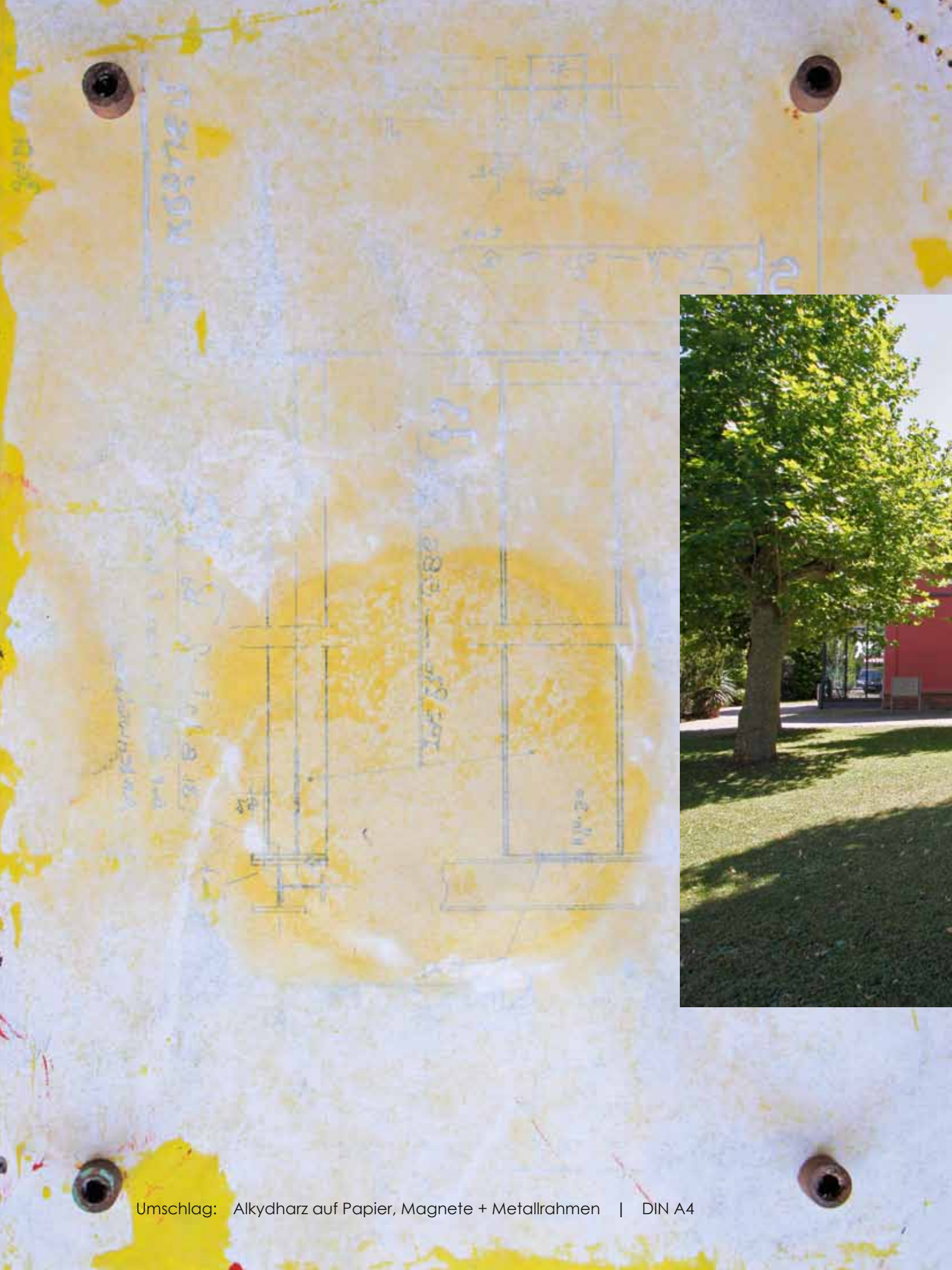
Umschlag: Alkydharz auf Papier, Magnete + Metallrahmen | DIN A4